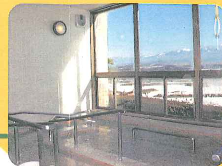
日帰り温泉 浴室・休憩所